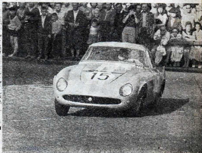
Fousek s vozem Skoda v ostré zatáčce