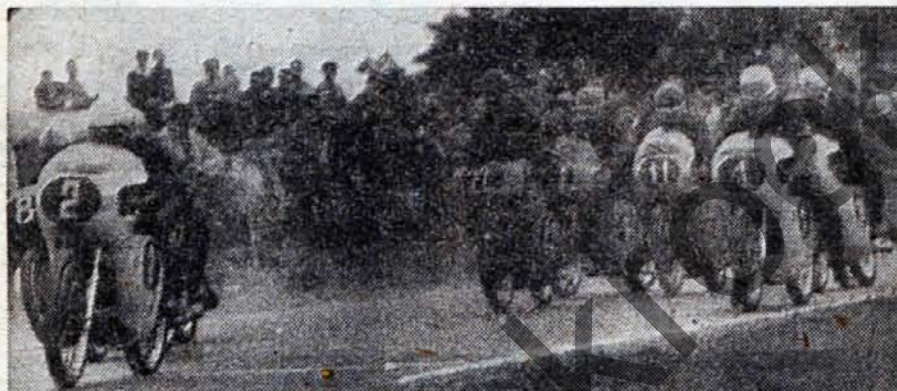
Start třídy do 125 ccm, Žípek (2). ujíždí vpřed, Bojer (1) teprve nasedá

přijel na start Parus tentokrát s velmi dobře připraveným strojem (ve třídě do 125 ccm se mu nepodařilo odstartovat) a do-